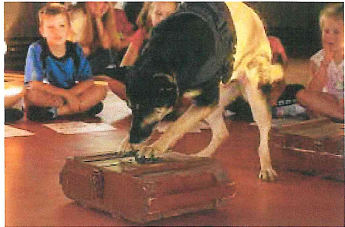
Zajęcia z dziećmi „Fabryka nadziei”

Łącznie w 2023 r. powyższymi programami oraz działaniami objęto: