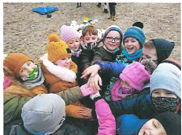
Zajęcia z dziećmi „Fabryka nadziei”