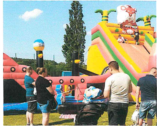
Gminny dzień dziecka w Wartosławiu 2023