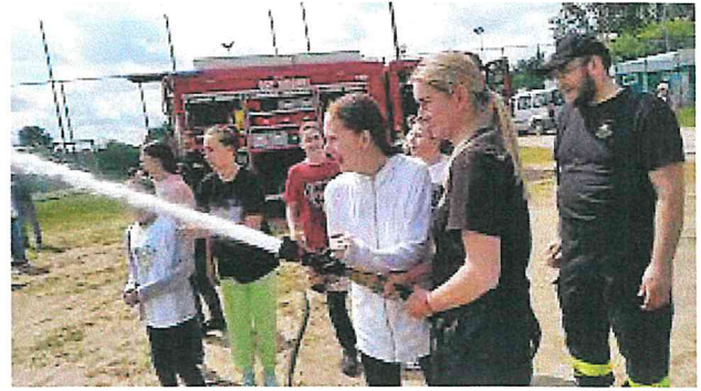
Zajęcia z dziećmi „Fabryka nadziei”