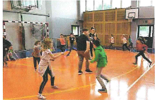
Zajęcia z dziećmi „Fabryka nadziei”