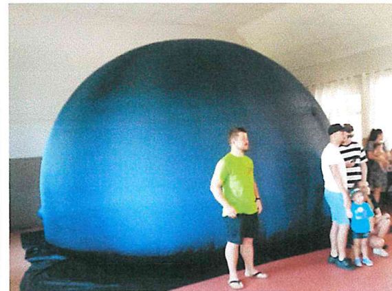
Gminny dzień dziecka w Wartosławiu 2023