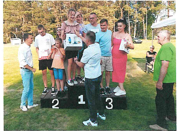
Gminny dzień dziecka w Wartosławiu 2023