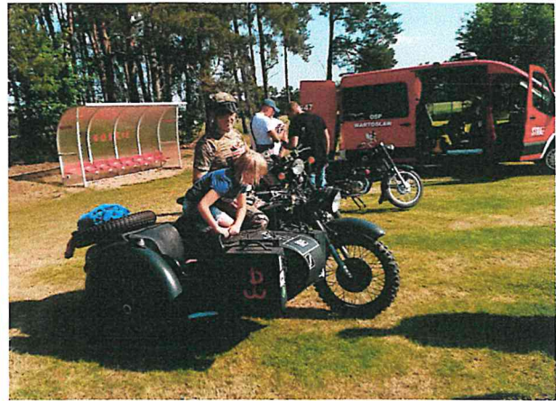
Gminny dzień dziecka w Wartosławiu 2023